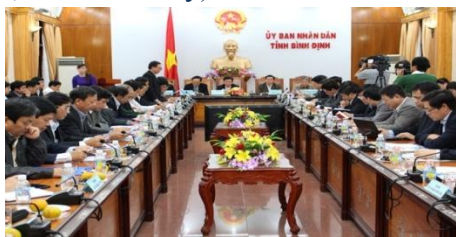
Quang cảnh cuộc họp ngày 17/01/2015

Chiều 17/1, UBND tỉnh Bình Định tổ chức cuộc họp xin ý kiến các bộ, ngành Trung ương xung quanh những vấn đề liên quan đến Dự án Tổ hợp lọc hóa dầu ASEAN (Dự án Victory).