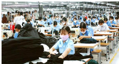
Công nhân đang làm việc tại một nhà máy của Tập đoàn Vinatex

Tin từ Tập đoàn Dệt may Việt Nam (Vinatex) cho biết, trong năm 2015, Tập đoàn sẽ đầu tư xây dựng Khu liên hợp sợi - dệt nhuộm - may Hương An (xã Hương An, huyện Quế Sơn, tỉnh Quảng Nam) với quy mô 20ha, tổng vốn đầu tư khoảng 1.145 tỷ đồng.