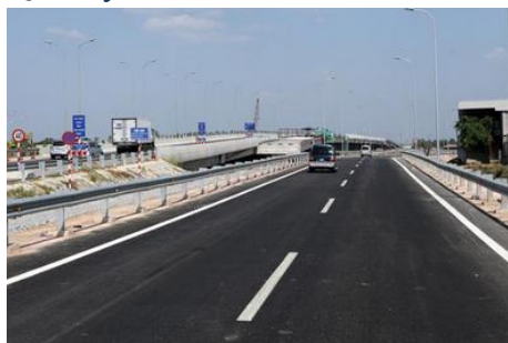
Tuyến cao tốc lên Tây Nguyên sẽ kết nối hoàn chỉnh với đường cao tốc TP.HCM - Long Thành - Dầu Giây và Biên Hòa - Vũng Tàu