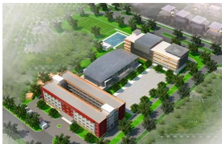
Mô hình trường của KinderWorld tại TP Nha Trang, Khánh Hòa

Tiềm năng phát triển kinh tế đi kèm việc tạo điều kiện thuận lợi từ lãnh đạo tỉnh và chủ đầu tư các dự án hạ tầng là điều kiện tiên quyết để các dự án FDI giáo dục mở rộng hoạt động sang các tỉnh lân cận TP. Hà Nội và TP.HCM.