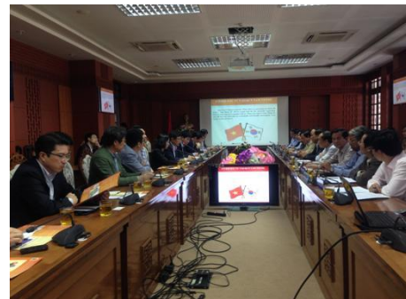
Quang cảnh tại buổi làm việc

Sở, ngành: Kế hoạch và Đầu tư, Công thương, Ban Xúc tiến đầu tư và Hỗ trợ doanh nghiệp, BQL Khu Kinh tế mở Chu Lai, Cục Hải quan, Công ty Điện lực Quảng Nam, Công ty Phát triển Hạ tầng KCN Chu Lai, UBND thành phố Tam Kỳ, Văn phòng UBND tỉnh.