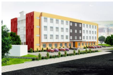
Ảnh minh họa.

Chủ tịch UBND tỉnh Bình Định Hồ Quốc Dũng vừa có văn bản chấp thuận chủ trương cho Tập đoàn giáo dục Kinderword (Singapore) triển khai các thủ tục đầu tư xây dựng 2 dự án Trường Quốc tế Việt Nam – Singapore và Trường giáo dục kỹ năng sống Outwar bound Việt Nam trên địa bàn tỉnh.