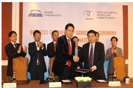
Đại diện Vinatex và Itochu ký Bản thỏa thuận hợp tác kinh doanh

Thỏa thuận hợp tác mới giữa Vinatex và Tập đoàn Itochu sẽ mở ra một chuỗi các dự án về dệt nhuộm hoàn tất và nguyên phụ liệu tại Việt Nam.