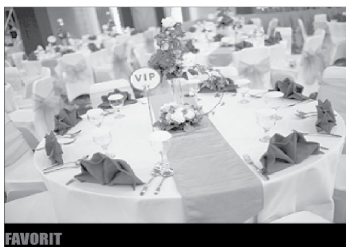
FAVORIT Mie kangkung ala Horison Ultima menjadi favorit bagi pengunjung.

spesial sehingga menjadi alternatif bagi tamu bersama keluarga maupun rekan bisnis. Sebagai teman saat menyantap hidangan, tamu dapat memesan berbagai jus dan minuman segar yang ditawarkan. Tamu dapat menikmati hidangan penutup yang