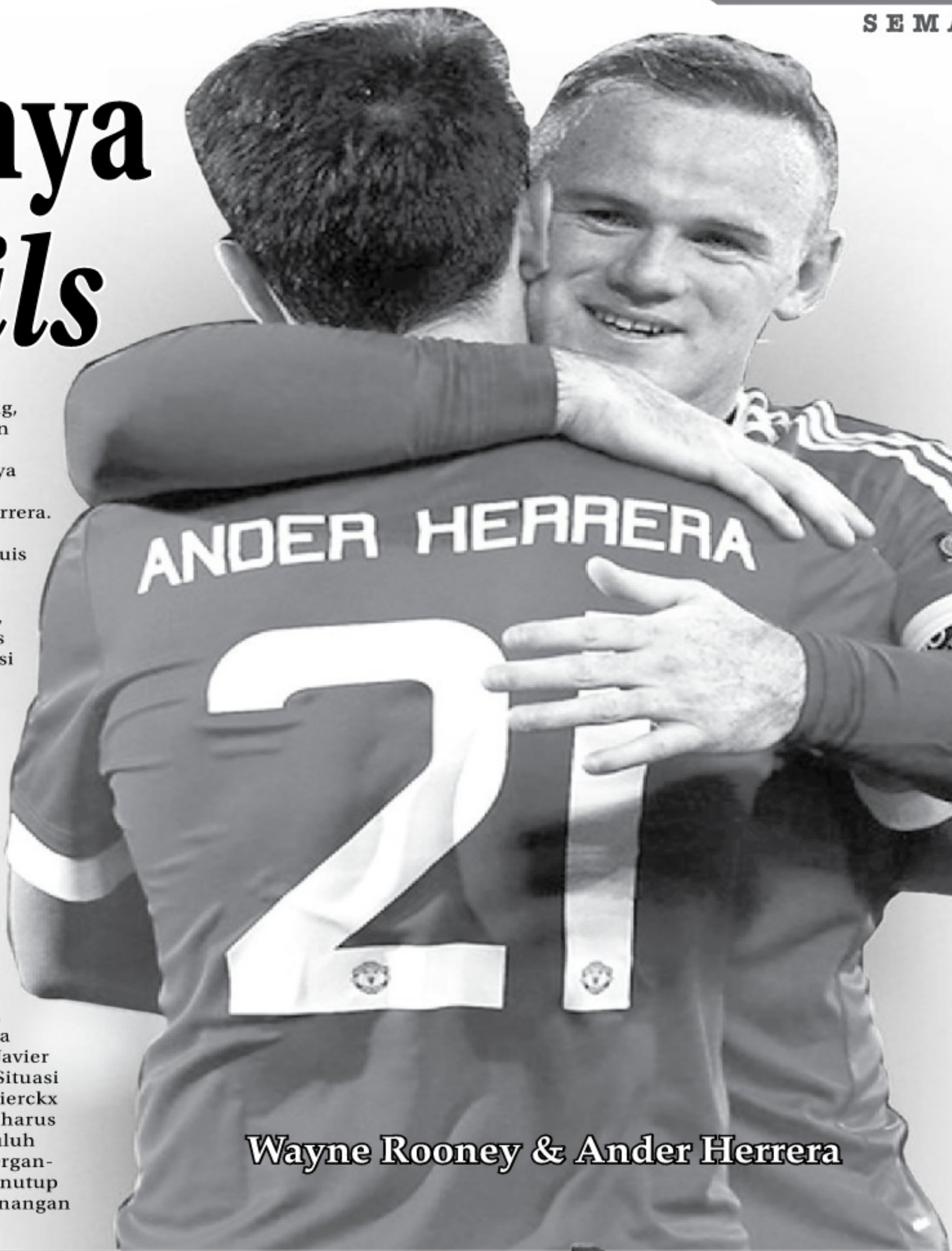
Wayne Rooney & Ander Herrera