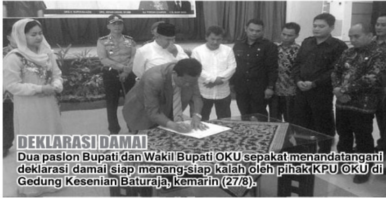
DEKLARASI DAMAI Dua paslon Bupati dan Wakil Bupati OKU sepakat menandatangani deklarasi damai siap menang siap kalah oleh pihak KPU OKU di Gedung Kesenian Baturaja, kemarin (27/8).

“Kami sangat berharap kepada kedua paslon, maupun tim sukses dan para simpatisan agar dapat menciptakan pemilu yang damai dan bermartabat. Kami sendiri KPU akan benar-benar berada ditengah dengan menjunjung tinggi sikap netralitas dan independen, tanpa harus memihak kepada salah satu kandidat paslon. Selain itu kami meminta kepada pemerintah daerah, maupun instansi lainnya untuk membantu kami, agar kami selalu dapat berada di tengah-tengah,” kata Nanning.