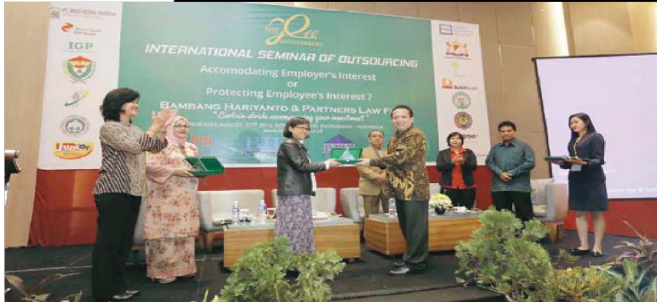
A Samodra SH MH dari Kantor Hu

O UTSOURCING yang menjadi polemik bagi sebagian pekerja di Indonesia, maupun di Sumatera Selatan (Sumsel) yang memang merupakan permasalahan serius bagi masyarakat, sehingga perlu dibahas dengan sangat mendalam agar terpecahkan permasalahannya.