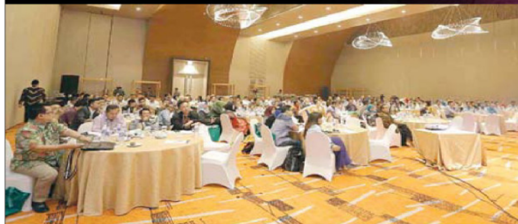
Kantor Hukum BHP.