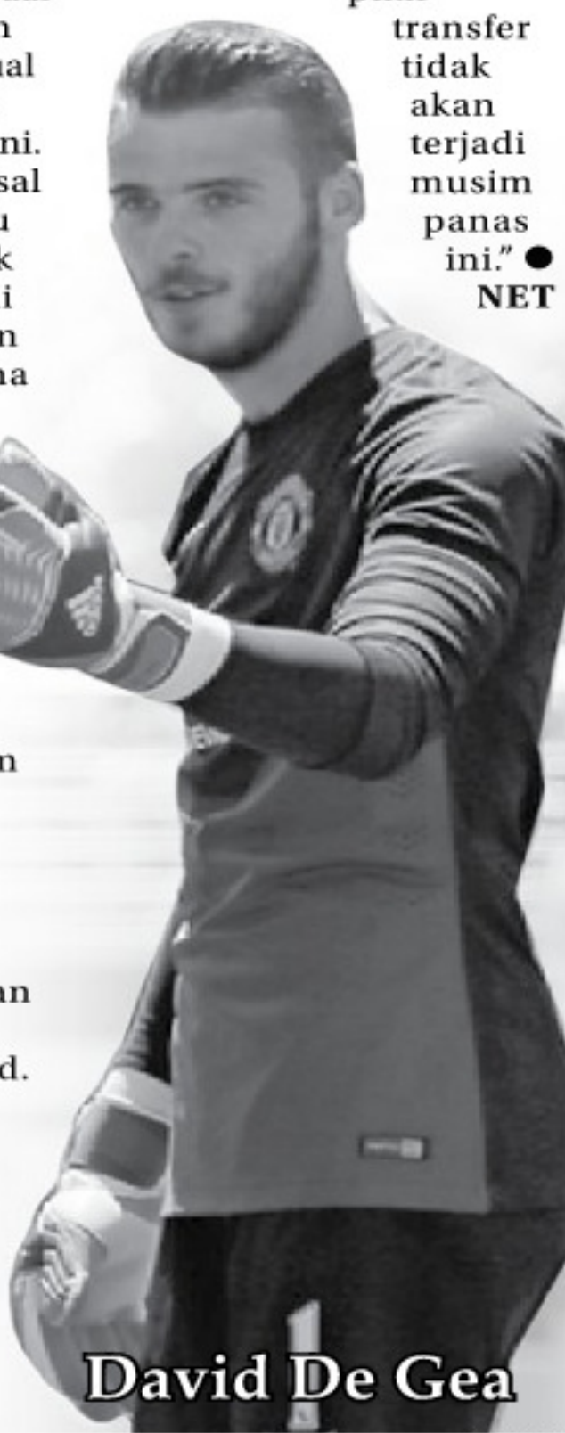
David De Gea